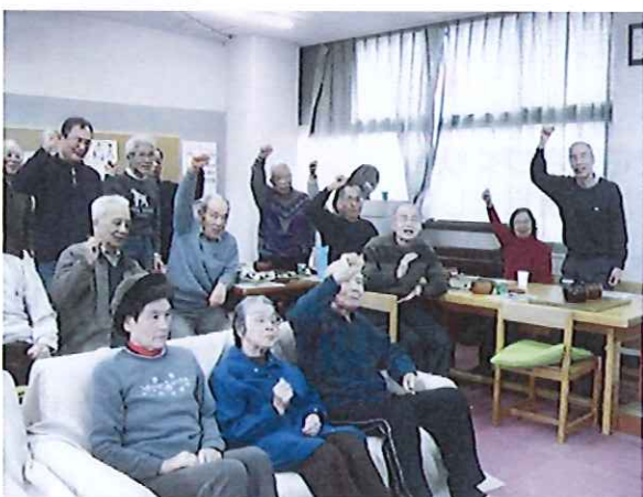
(皆さまから熱い応援を頂きました)