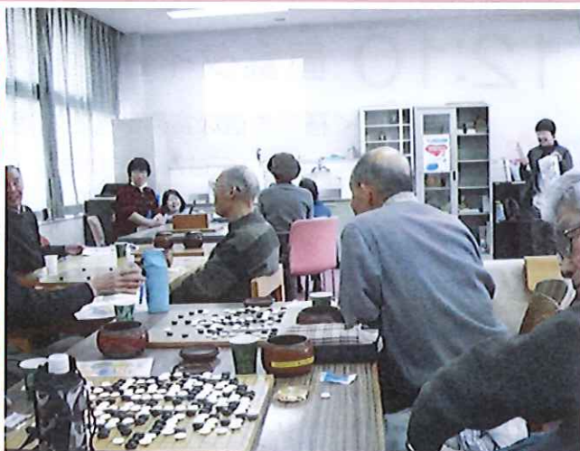
(平成29年2月7日のバレンタイン企画の様子)

今後も気軽に小倉デイホームを利用いただき、皆さまと交流を深めていきたいと思っております。『こんなことをしたら良いなあ』と良い案がひらめきましたら、「小倉デイホーム」に 来て見て参加 して下さい。