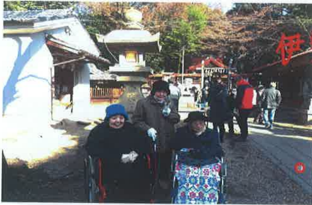
伊勢田神社へ初詣