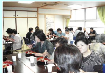
皆さま、お弁当や新茶でほっこり