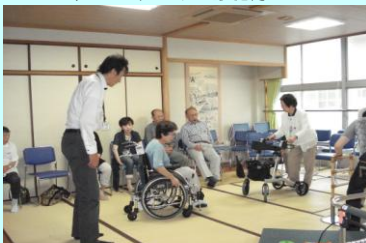
車椅子の使い方の勉強会