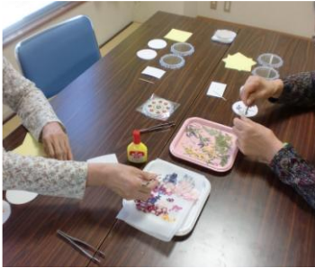
①花びらを選んでいきます

平成 26 年 7 月から毎月第 3 木曜日に「きらめき創作教室」を開催しています。 押し花を応用したコースターやしおり、壁飾り、花柄のお皿などを作っています。