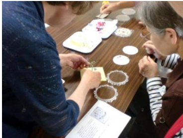
③先生のアドバイス