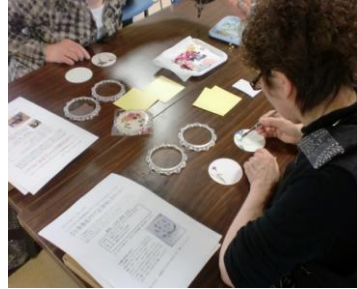
②花びらを乗せていきます