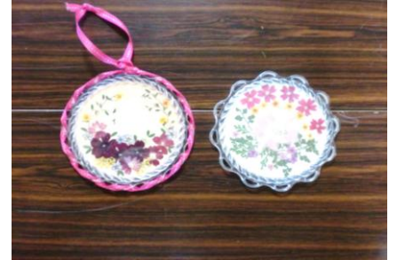
④きれいな「コースター」完成